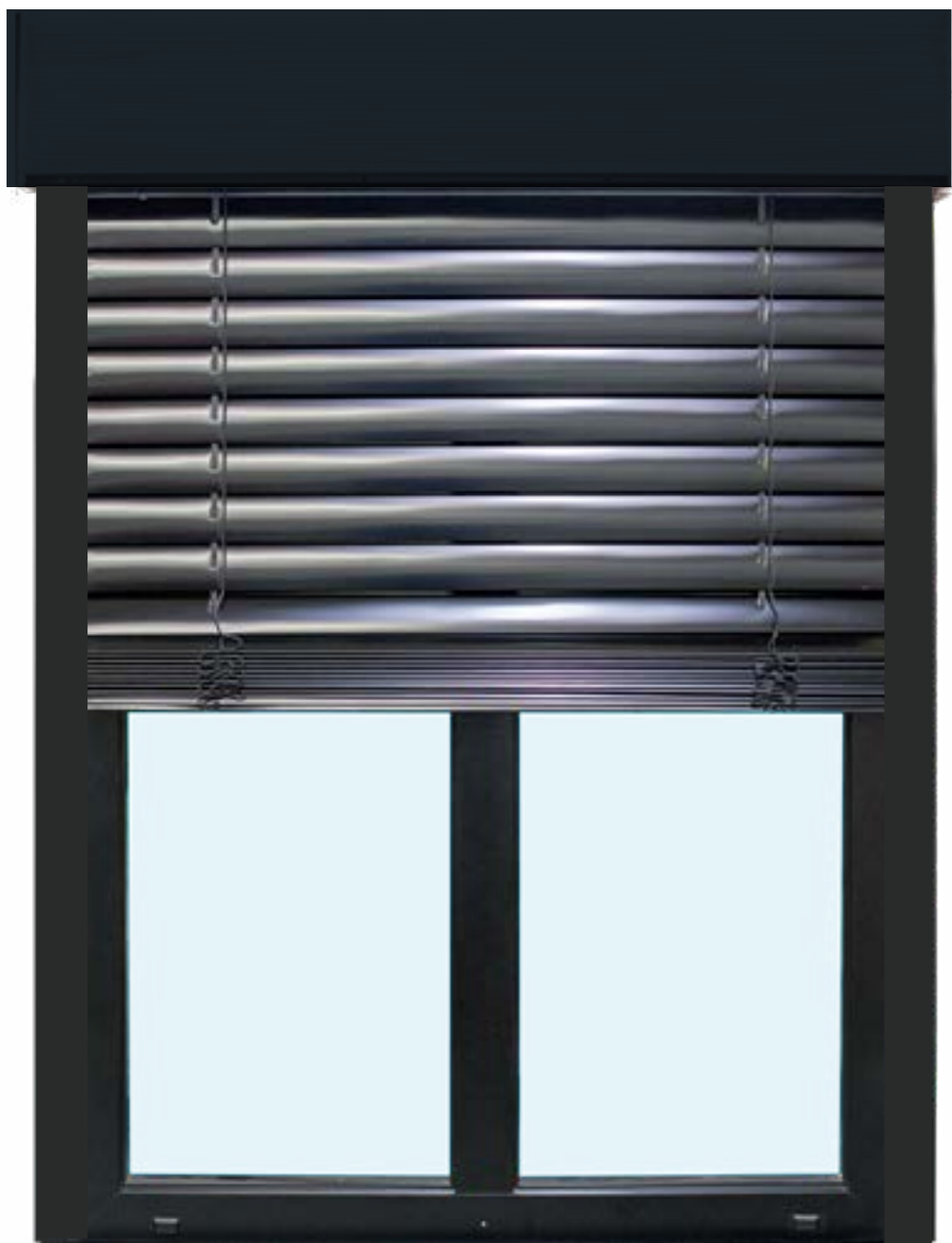
FENSTER | HOLZ - ALU | DDA-78 & RAFFSTORE | ALU