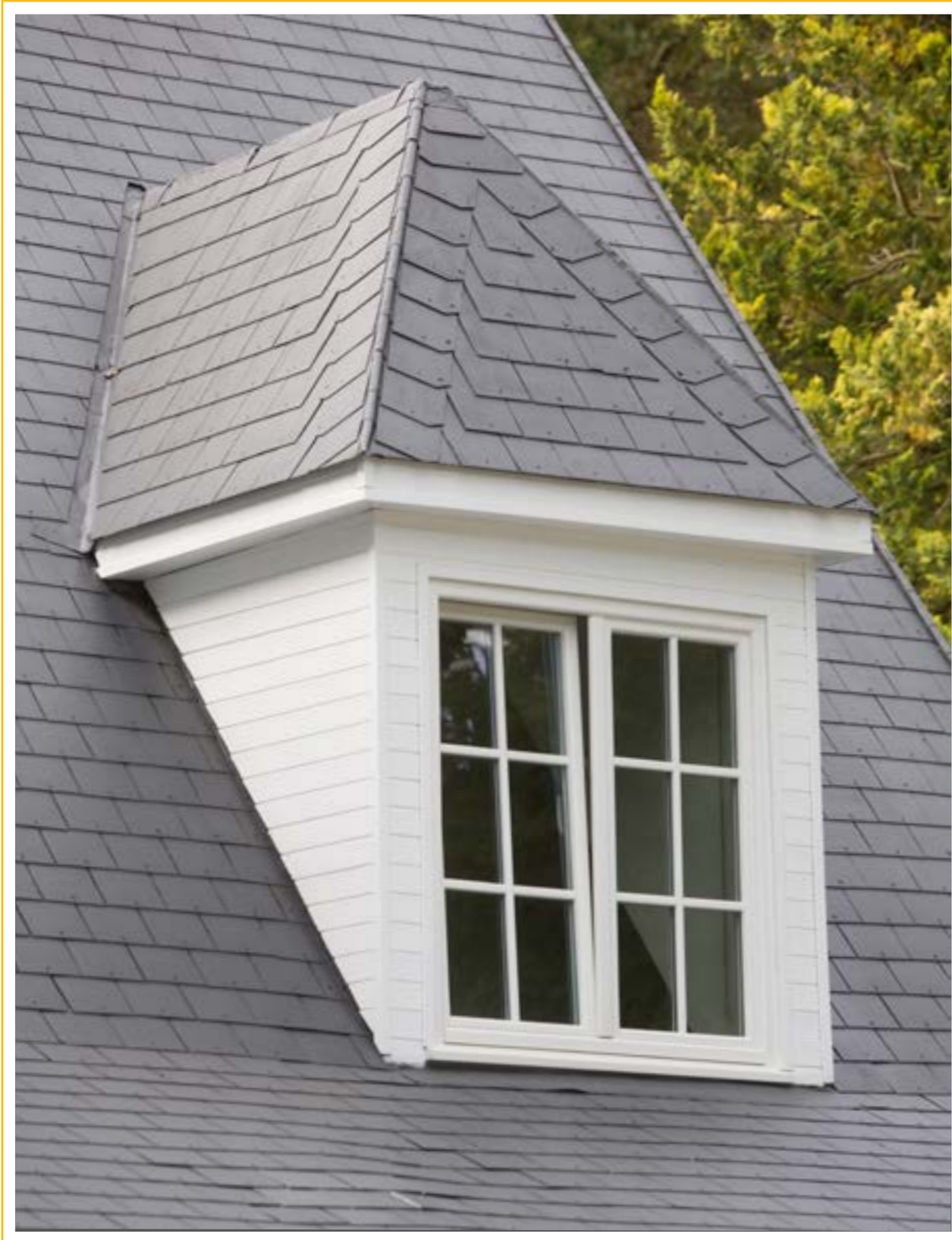
FENSTER | HOLZ | DDF-78