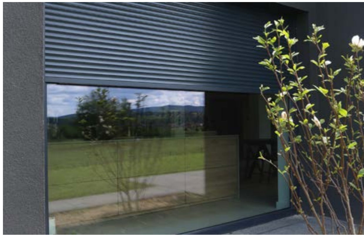
ROLLADEN | ALUMINIUM