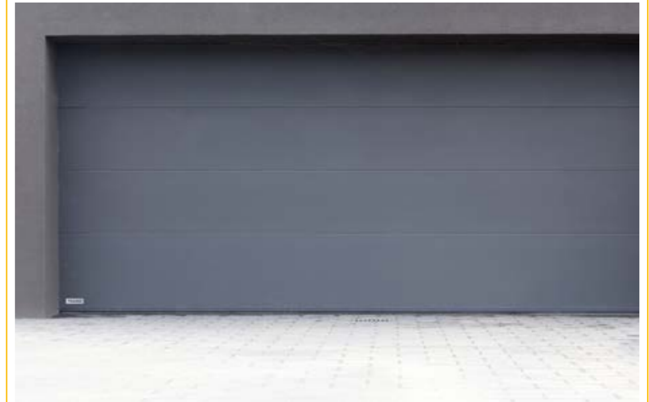
GARAGENTOR | PANEEL | MODELL NOEL