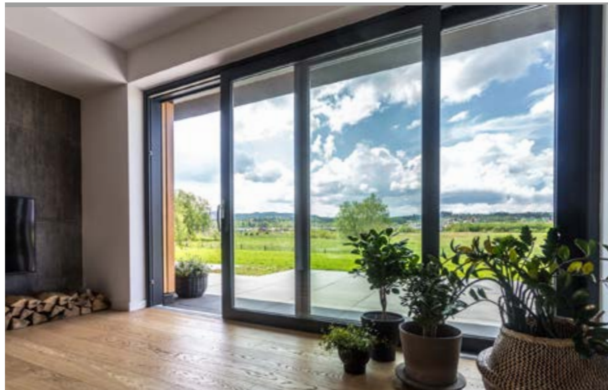
FENSTER | ALUMINIUM | HST