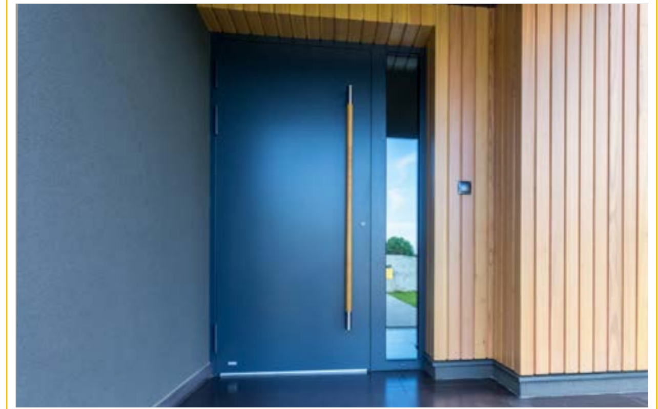
EINGANGSTÜRE | ALUMINIUM | MODELL NOEL