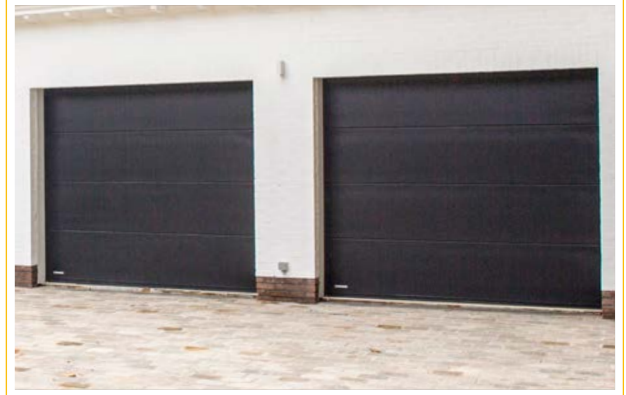
GARAGENTORE | ALUMINIUM