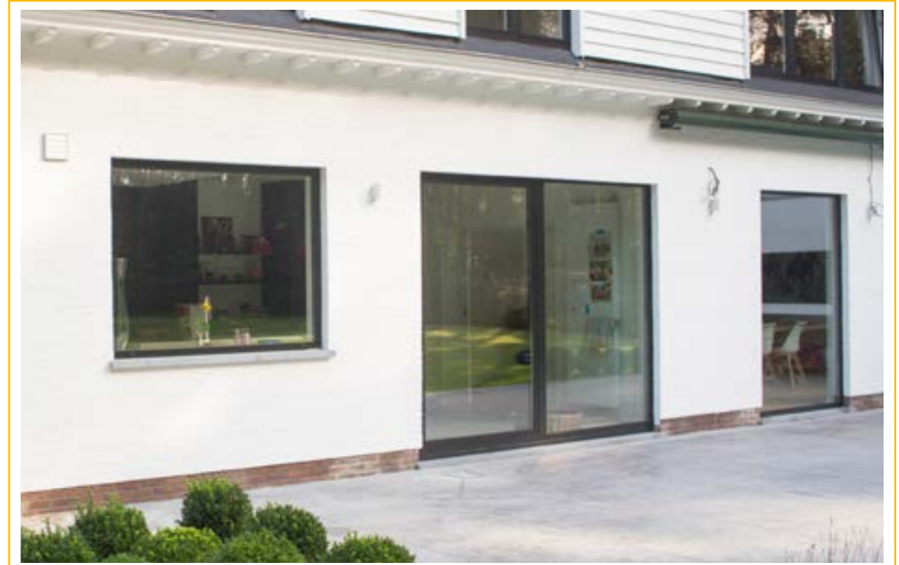
FENSTER | ALUMINIUM | SCHIEBETÜREN DA-77 ST